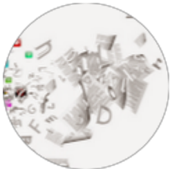
D -Co 6 Septembre 2023

J'ai fait appel à CD+formation pour un bilan de compétences. Un très bon accueil, accompagnement sérieux . Je suis satisfaite du résultat , j'ai trouvé une formation adaptée à mes envies et besoins